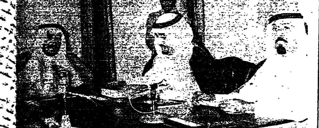
الملك خالد لدى ترؤسه اجتماع مجلس الوزراء الذي اقرت فيه الخطة الخمسية، ويبدو الى يمينه امير قطر...